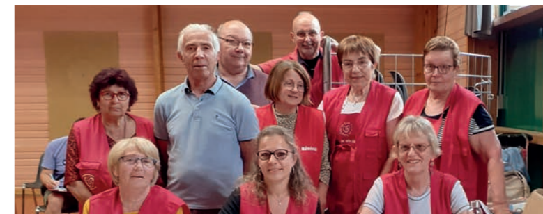
L'Association des Donneurs de Sang Bénévoles remercie tous les donateurs et leur souhaite un bel été.

LE 4 JUIN DERNIER, 104 DONNEURS, DONT 12 NOUVEAUX, ONT PARTICIPÉ À LA COLLECTE DE SANG. Ainsi 312 vies ont potentiellement été sauvées puisqu'un don d'1 heure peut aider 3 patients différents ! En effet, on ne transfuse jamais la totalité du sang donné à un malade, mais uniquement le produit sanguin dont il a besoin : soit des globules rouges, soit du plasma, soit des plaquettes. Alors, pour tous ceux qui souhaitent réaliser un acte altruiste et vital, la prochaine collecte aura lieu mardi 30 juillet, de 15 h 30 à 19 h 30, salle Yves du Manoir (complexe sportif La Croix des Tailles). L'ADSB conseille de prévoir de quoi boire pendant le don et de réserver son créneau horaire sur dondesang.efs.sante.fr . Par ailleurs, comme chaque année, l'ADSB organise son loto. Pour 2024, il se tiendra dimanche 27 octobre, Salle Paul Bouin à Basse Goulaine.