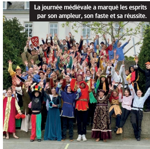
La journée médiévale a marqué les esprits par son ampleur, son faste et sa réussite.

Le 13 mai dernier, après des mois de préparation, les 5 e du collège Saint Gabriel ont vécu une journée à l'heure médiévale. Ce projet, bâti en début d'année par 3 professeures, avait pour but de plonger la centaine d'élèves concernés au cœur d'une journée de fête au Moyen-Âge : le couple royal français accueillait son homologue britannique, entourés de leur cour, du peuple et de nombreux ménestrels.