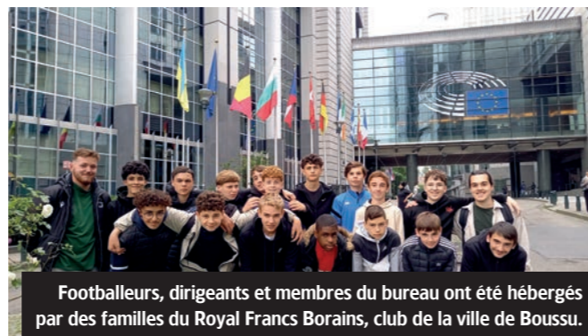
Footballeurs, dirigeants et membres du bureau ont été hébergés par des familles du Royal Francs Borains, club de la ville de Boussu.