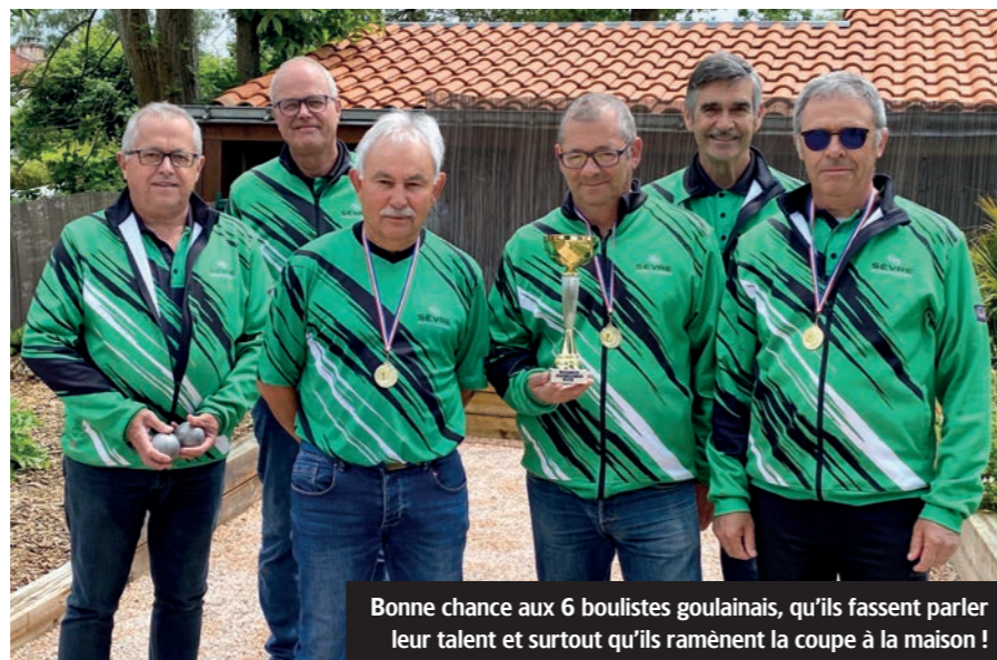
Bonne chance aux 6 boulistes goulainais, qu'ils fassent parler leur talent et surtout qu'ils ramènent la coupe à la maison !

LES 6 ET 7 JUILLET PROCHAINS, À SAINT YRIEIX LA PERCHE (EN HAUTE VIENNE), 2 triplettes goulainaises porteront fièrement les couleurs de leur club et de la commune lors des 60 e championnats de France de pétanque. Obtenant sa qualification grâce à sa 6 e place au concours