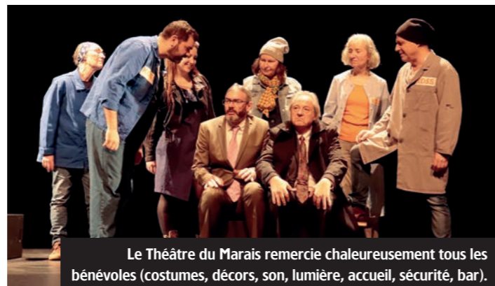
Le Théâtre du Marais remercie chaleureusement tous les bénévoles (costumes, décors, son, lumière, accueil, sécurité, bar).