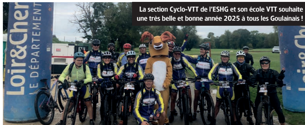
La section Cyclo-VTT de l'ESHG et son école VTT souhaite une très belle et bonne année 2025 à tous les Goulainais !