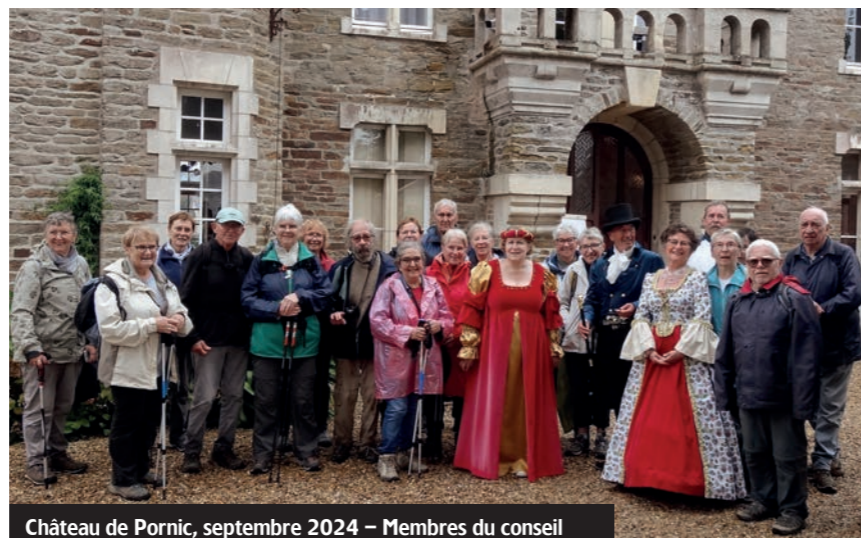
Château de Pornic, septembre 2024 - Membres du conseil d'administration et adhérents présentent leurs meilleurs vœux.