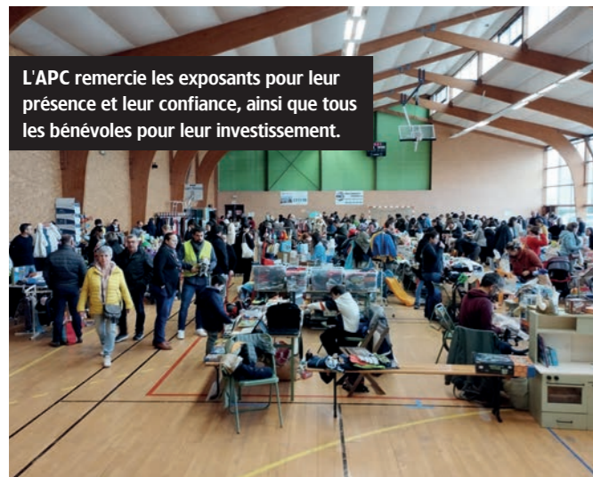
L'APC remercie les exposants pour leur présence et leur confiance, ainsi que tous les bénévoles pour leur investissement.

En fin d'année 2024, l'Association des Parents de la Châtaigneraie [APC] a multiplié les gestes durables et solidaires.